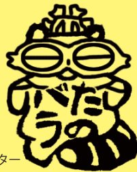
たのバラ 縄文キャラクター