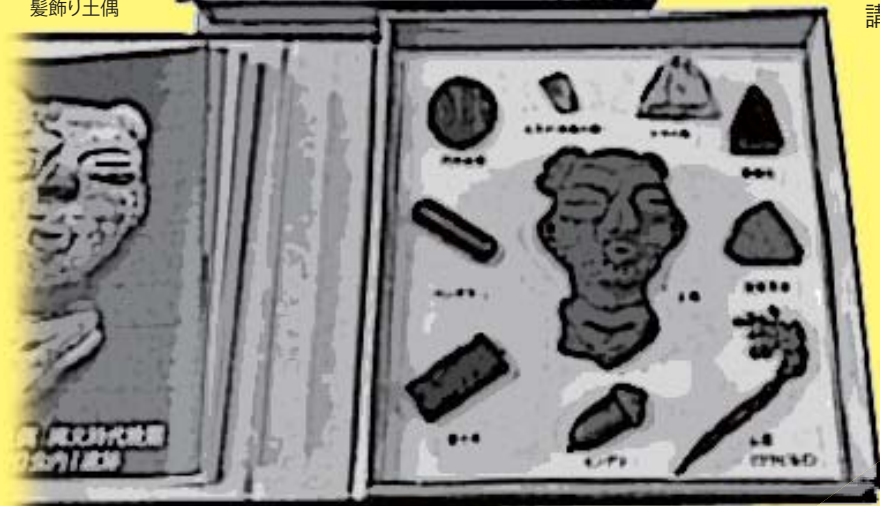
縄文標本 サンプル