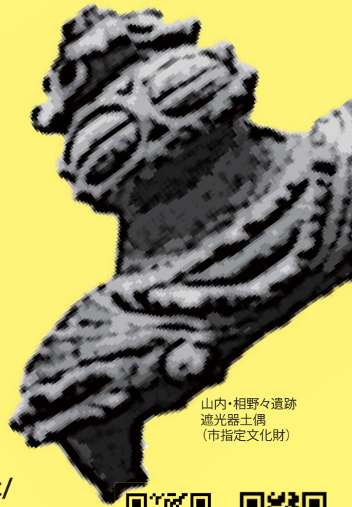
山内・相野々遺跡 遮光器土偶 (市指定文化財)

会場：あさくら館 横手市朝倉町6-38 募集人数：先着 30人 (小学3年生~中学生) 参加費：500円 持ち物：マスク・筆記用具・飲み物 申込方法：メール: info@tanobara.net